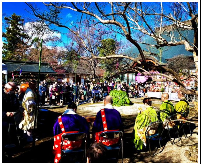
本堂前に結界を張り、柴燈護摩道場を整えた上で、すべてのお人形を飾って最後のお披露目をします

しかし今年はどうしたわけか非常にたくさんのお供養依頼をいただき、相当数の人形さんたちが集まりました。また当日は大勢の参拝者の方々がお越しになり、一時境内は人であふれかえるようでした。供養者の方々の話をお聞きしていると、そのお人形一体一体に様々な物語があることがよくわかります。その役目を終えたあまたの人形達を前にすると、何とも言えない緊張感を覚えます。